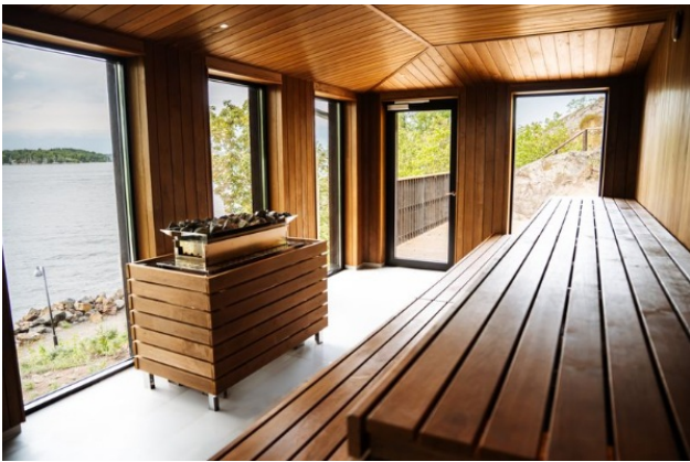
The new panorama sauna at Hotel J.

Hotel J, strax utanför Stockholm, har fått sitt namn från 1930-talets J-klass segelbåtar, kända för sitt fina hantverk och sin eleganta design. Det nyöppnade hotellet erbjuder en stilren nautisk atmosfär, perfekt för avkoppling nära skärgården. Intill ligger Tornvillan från 1889, vars charm noggrant bevarats under renoveringen. Hotellet har rum med havsutsikt, bastu med panoramavy och serverar säsongsbetonade menyer på närbelägna Restaurang J. För mer info.