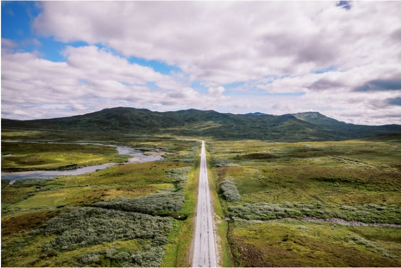
Stekenjokk plateau samt Vildmarksvägen.

Att förbättra sin hälsa toppar årligen listan över nyårslöften enligt undersökningar från opinionsinstitut YouGov i både Storbritannien och USA och naturen spelar en avgörande roll för människors hälsa och välbefinnande enligt Världshälsoorganisationen (WHO) . Samtidigt visar flera studier att natur på recept har positiva effekter på både kardiometabolisk och mental hälsa. Sverige, världens första land att rekommenderas av läkare , har mycket att erbjuda resenärer som vill koppla av och njuta av natur och äventyr. Här följer några tips på naturupplevelser i Sverige som kan göra 2026 till ett minnes värt år. För mer information om respektive nyhet klicka HÄR