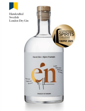
Nyligen tilldelades Hernö Gin den prestigefyllda titeln Årets Ginproducent. Det är andra året i rad som destilleriet får högsta utmärkelsen vid International Spirits Challenge, för "konsekvent hög kvalitet över hela sitt gin-sortiment". Den högsta utmärkelsen för en enskild produkt, Trophy, gick till Hernö én-gin framtagen i samarbete med hyllade kocken Björn Frantzén.

Och inte nog med att Sverige är hem till ett av världens bästa gin - en av världens 50 bästa barer ligger i Stockholm The World's 50 Best har nyligen publicerat årets lista över barer världen över, och bland dem hittar vi Röda Huset på plats 35. Baren och restaurangen arbetar med en nordisk stil, där svenska råvaror och säsongens smaker står i centrum. Samtidigt som listan över World's 50 Best Bars släpptes skriver även Vogue Scandinavia att Röda Huset är mer än en bar – snarare ett "kulturellt nav" och ett "utmärkt exempel på regionens förmåga att förena innovation och tradition" Meet the innovators putting Swedish beverages on the international drinks list (Visit Sweden)