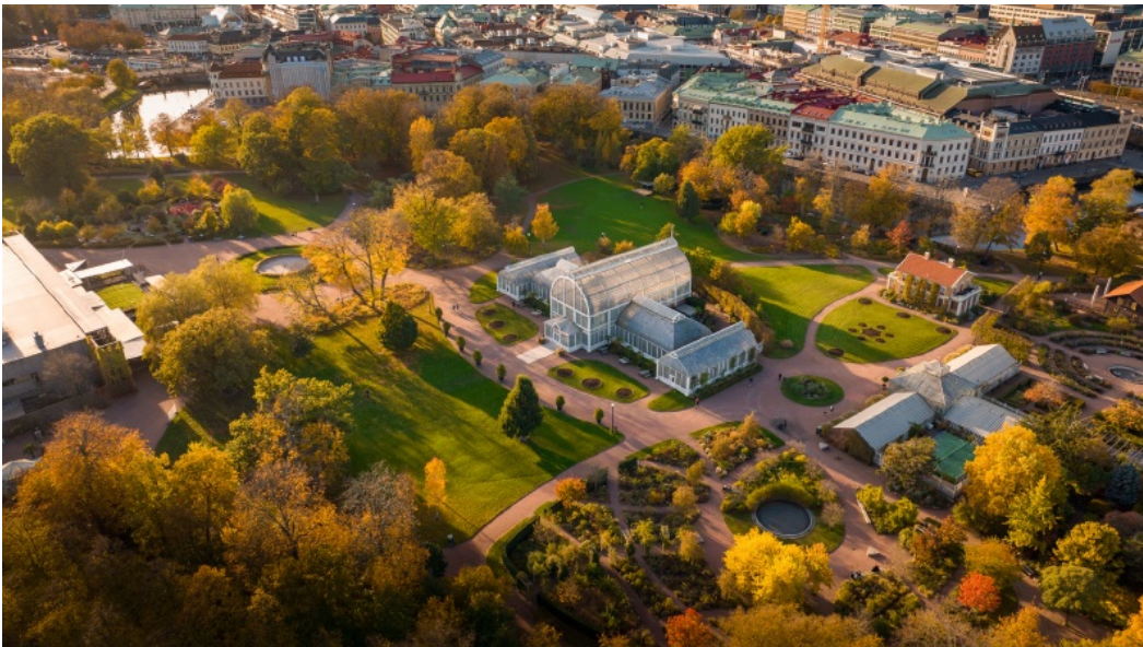
Photo : Vue aérienne de Göteborg.

Voir la vidéo city [AL1]break à Stockholm.