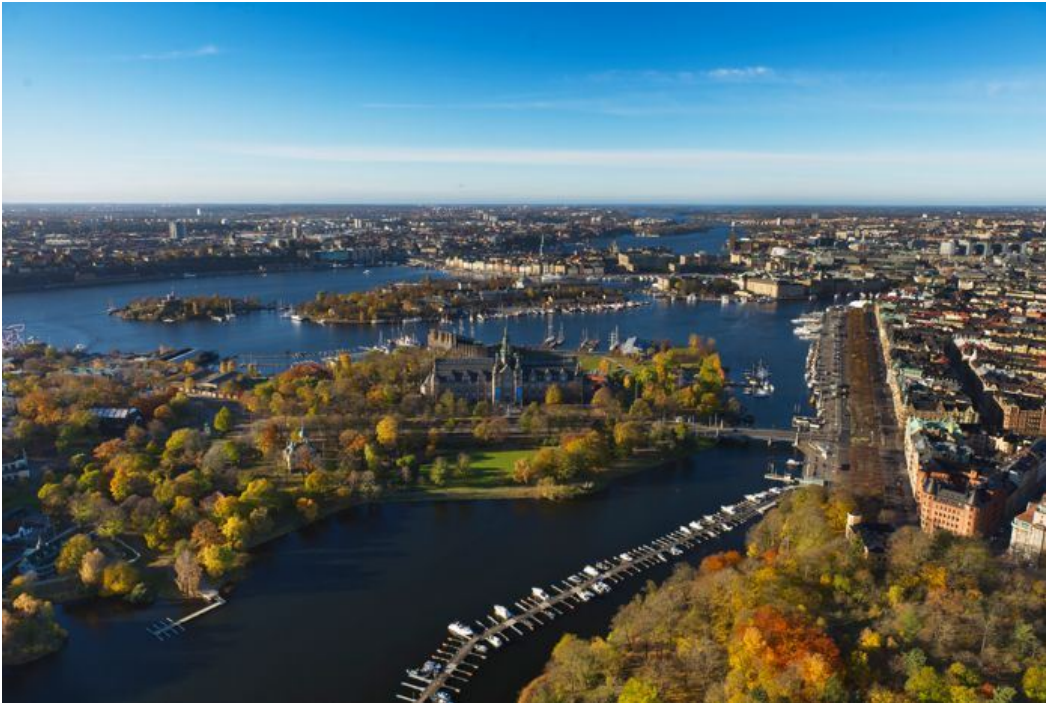
Vue aérienne de Stockholm.

Avec Stockholm désormais classée parmi les 10 meilleures villes européennes selon le prestigieux classement Europe's Best Cities de Resonance Consultancy, et un net regain d'intérêt mondial pour Göteborg et Malmö, les grandes villes suédoises sont sous les projecteurs. Ce nouvel engouement s'explique par un savant équilibre entre vie urbaine, culture, art de vivre à la suédoise et nature accessible* à portée de tram, de ferry ou de vélo. Plus qu'un simple city break, ces villes offrent une véritable évasion. Focus sur les temps forts de l'automne.