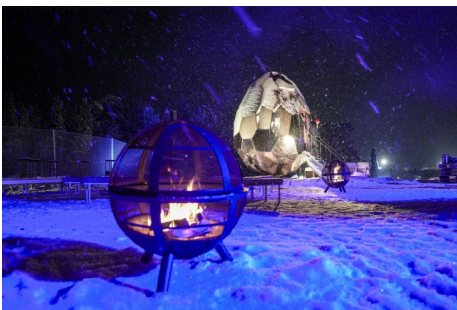
Photo: Inauguration emplacement final Kiruna. ( Télécharger )