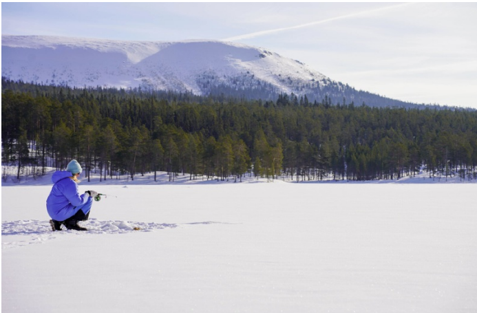
Download

9. Isfiske Vinterfiske är en enkel och avkopplande aktivitet som passar både nybörjare och erfarna fiskare. Att sitta ute på en frusen sjö, omgiven av gnistrande snö och klar, frisk luft, ger en känsla av ro och närhet till naturen. Med lite tur får du dessutom med dig egenfångad mat hem till bordet! För mer tips och inspiration klicka HÄR samt HÄR