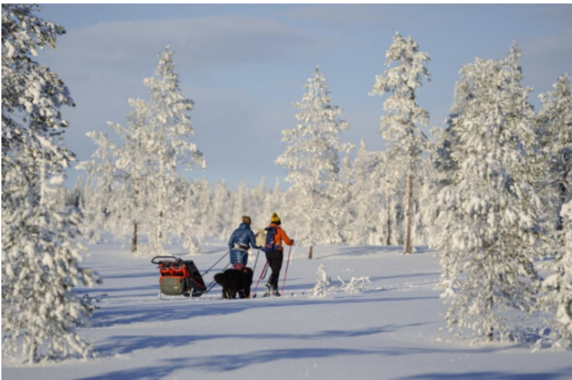
Download

7. Utförsåkning Med över 100 skidorter erbjuder Sverige en mängd varierade alternativ, från familjevänliga anläggningar till utmanande offpist områden. Oavsett om du söker en lugn familjevistelse eller mer krävande åkning, finns här något för alla. För mer inspiration klicka HÄR