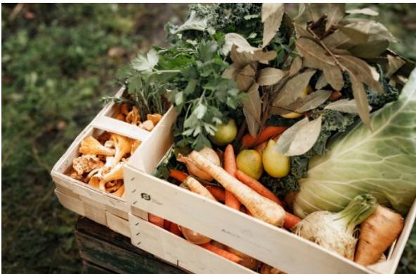
Download

Öppet 24/7 Sverige är en plats där du verkligen kan vara dig själv. Förutom yttrandefrihet och pressfrihet hyllas Sverige som ett av världens mest inkluderande och progressiva länder. Varje år anordnas Pridefestivaler över hela landet - Euro Pride har anordnats här tre gånger under de senaste tre decennierna. Sverige är helt enkelt en perfekt plats för en romantisk semester, oavsett vem du älskar.