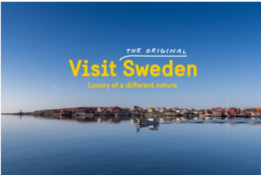
Download

I 2024, hvor "dupes" af alt fra håndtasker til kager er blevet trendy, tager Sverige et nyt skridt for at beskytte sin identitet. Mens modebrands kan varemærkebeskytte deres logoer og navne, kan lande ikke. Det vil Visit Sweden lave om på. Ingen ønsker jo, at en turist, der rejser til Sverige for at opleve den magiske skærgård, det spektakulære nordlys, den svenske fika eller møde en elg eller to, skal ende i det forkerte Sweden .